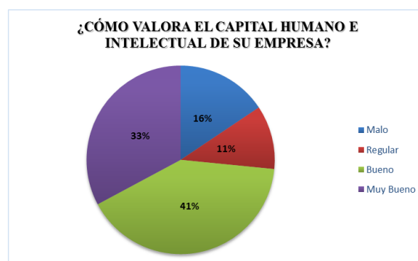
Gráfico 1: Valorar el capital humano e intelectual de su empresa.