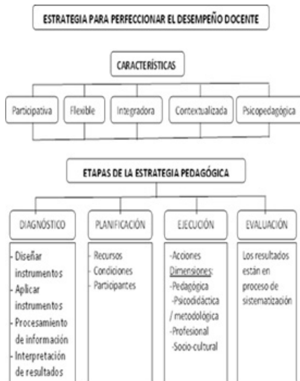
Figura 4. Esquema de la estrategia pedagógica

A continuación se bosqueja la estrategia pedagógica a implementar