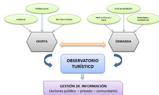
Gráfico2 Sistema de Gestión de Información Turística. Elaborado por el grupo de investigación

En relación al diseño de un sistema de gestión de información turística basada en la oferta y la demanda de sol y playa se estableció el siguiente esquema: