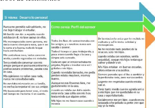
GRÁFICO 3. ÁRBOL DE TESTIMONIOS