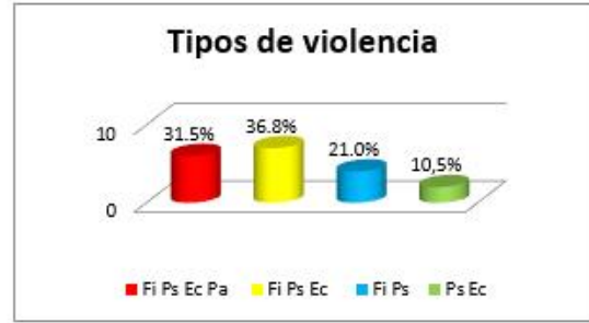
FIGURA 1. MUJERES QUE RECIBEN VARIOS TIPOS DE VIOLENCIA

mujeres que refieren este tipo de agresiones, que corresponde al 54.2%.